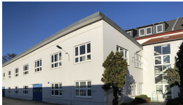
Haus 9, Ansicht vom Innenhof

Der Fachbereich Steuer- und Staatsfinanzverwaltung belegt in 2019/2020 Räume im 1. OG des Hauses 9. Jeweils zugeordnet befinden sich dort auch die Dozentenbüros der Fachbereiche.