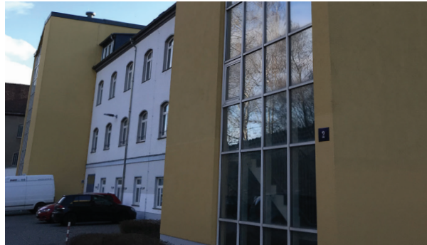
Haus 2, Ansicht vom Innenhof

Die dem Fachbereich Allgemeine Verwaltung 2019/2020 zugewiesenen Räume befinden sich im 1. und 2. OG des Hauses 2.